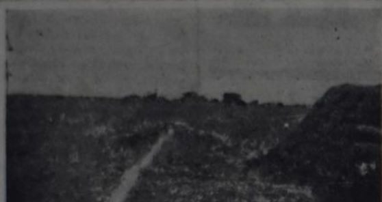
El problema de la tierra

UNA PRECIOSA FUENTE DE INFORMACION para los oradores del partido en especial para la Provincia de Buenos Aires, que enriquecerá su caudal de conocimientos para exponer desde la tribuna