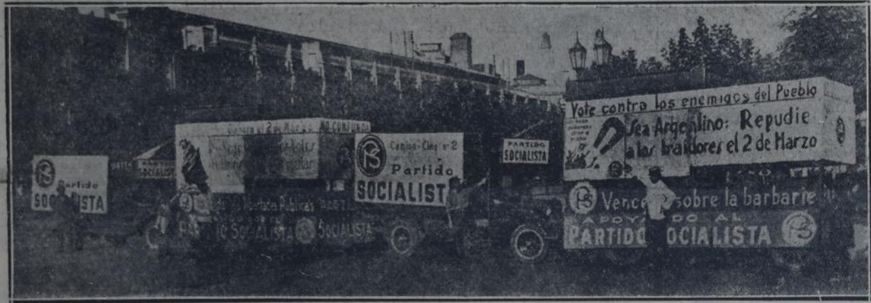
HE AQUÍ LOS CUATRO CAMIONES QUE UTILIZA EL PARTIDO SOCIALISTA EN SU ACTUAL CAMPAÑA ELECTORAL PARA SUS PROYECCIONES CINEMATOGRAFICAS Y QUE NOCHE A NOCHE INTERVIENEN EN LOS IMPORTANTES ACTOS QUE SE REALIZAN EN LOS DISTINTOS BARRIOS DE LA CIUDAD. POR EL MOMENTO, DOS DE ELLOS SE DESTINAN A LA EXHIBICIÓN DE LA CINTA "HACIA UN MUNDO NUEVO", Y LOS OTROS PARA PROPAGANDA GENERAL. Con oportunas y llamativas inscripciones y leyendas, los cuatro camiones socialistas aseguran al Partido los medios más formidables y eficaces de propaganda que pueden presentarse en esta campaña electoral y serán, sin duda, factores de primer orden en el gran triunfo socialista del próximo 2 de marzo.